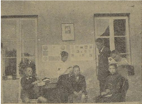
Fryzjerna Koła Mł. P.C.K. w Wilnie.