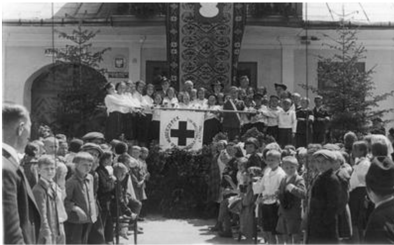
Koło Młodzieży PCK w Muczynie, 1939 r.